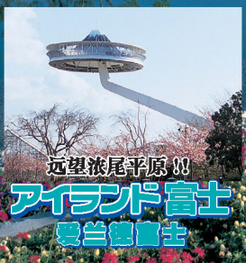
远望浓尾平原 W アイランド富士 爱尔兰富士