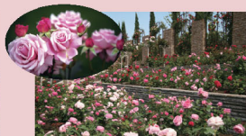
●玫瑰园（秋海棠花园内） 春秋两季，都可以观赏到玫瑰。