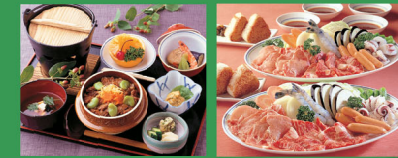
蛸刺身拼饭 烧烤 ※根据季节变化，菜单内容有时会有变动。 ※照片上的菜肴为4人份。