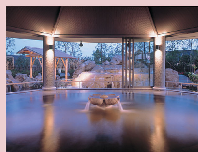
●大浴池“里之汤” 请到四季花卉簇拥着的露天浴池和天然温泉大浴场休闲。

光芒普照的名花之里 “冬之辉煌”冬季灯彩 (11月中旬-3月上旬左右) 冬季灯彩展示了“名花之里”的美丽自然与耀眼灯饰双重的幻想世界。尽享与昼间不同的气氛，度过优美舒适的时光。