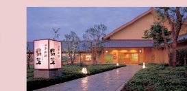
●日本料理“翡翠” 尽情品尝精湛的日本菜肴。