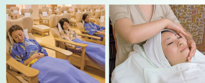
●休息室（免費） ●美容（收費）