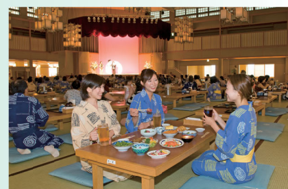
●在大廳舉行演出 ※表演的內容、時間、表演者有時會無預告變更，敬請諒解。