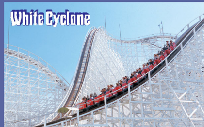
●白色旋風 世界最大級別木製過山車。陡坡上數不清的上下下， 木頭的吱吱嘎嘎，橫向搖晃，纜車輪的轟轟作響， 給您帶來起出超像的震撼。