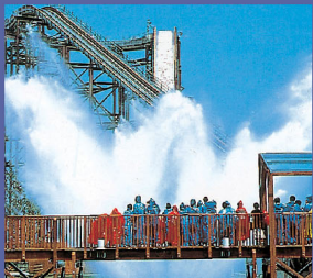
●滑來滑去 高30m、斜度40度的超動態急流滑水。