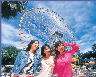
●大型觀覽車「極光」 離地90m的特別眺望。 享受360度全景觀。