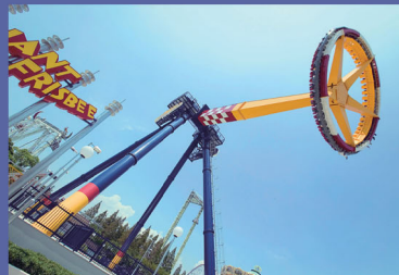
●大飛碟 該遊樂設施最高可將人搖至43m，實在令人叫絕。 可以讓您同時體會到放飛於空中的驚險刺激和浮游之感。